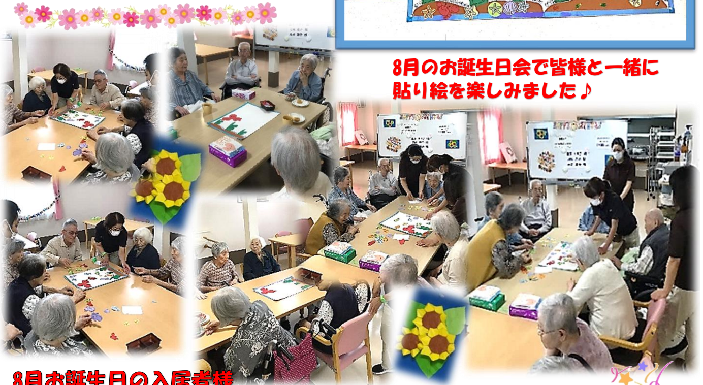
8月お誕生日の入居者様